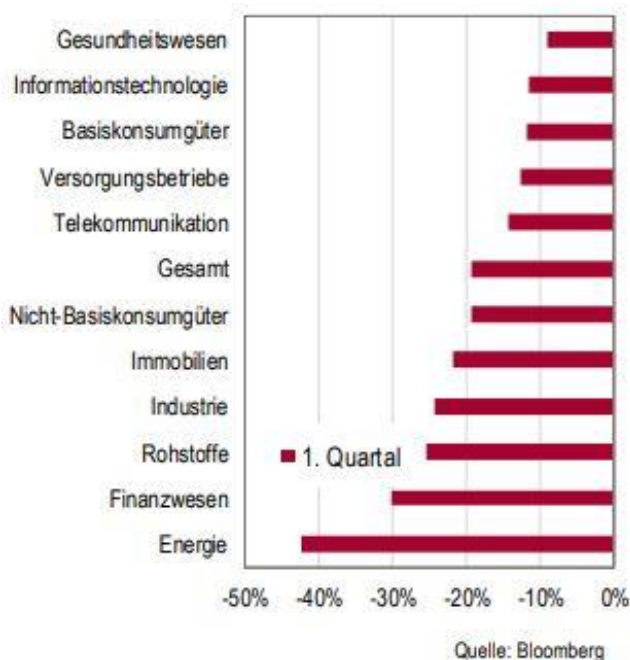
Sektorperformance in EUR

Bei AKTIEN ist unserer Meinung nach aufschlussreich, wie sich einzelne Sektoren der Wirtschaft in der bisherigen Krise gehalten haben